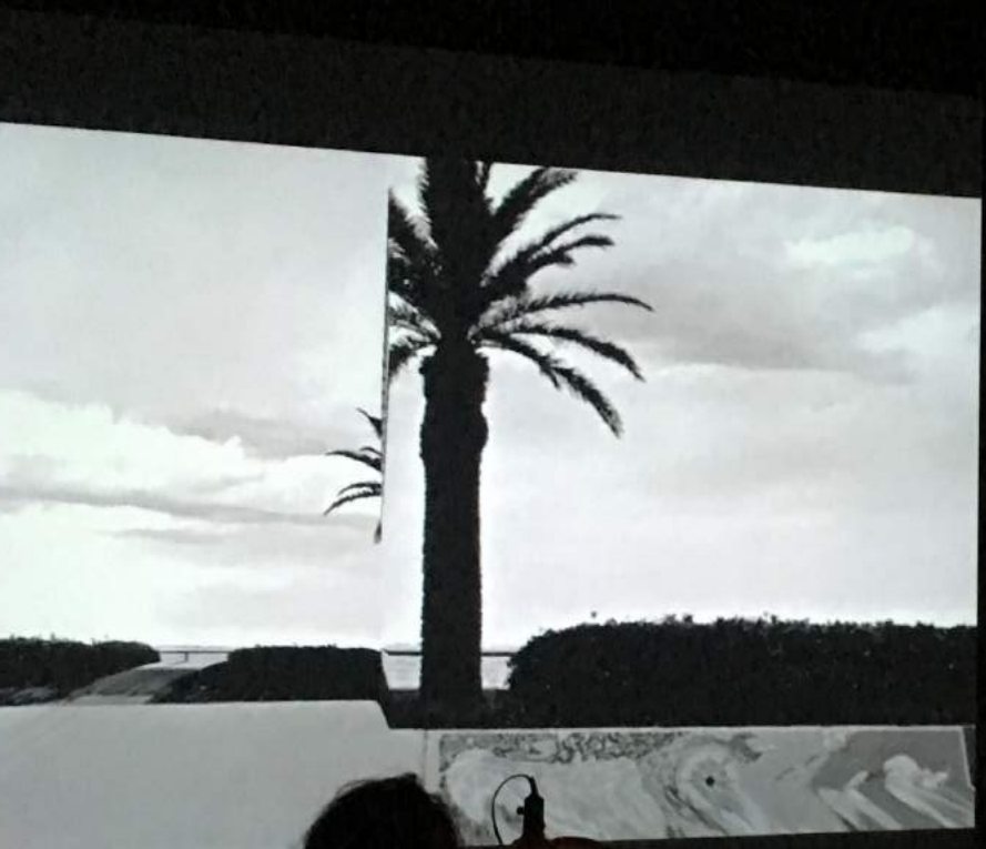
Temps local , performance AV de Folla Van Tès (Serge Valla & Philippe Fontes), Chapelle de l'Oratoire, 4 mai 2018, Clermont-Ferrand