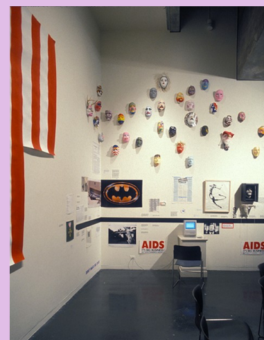
GROUP MATERIAL, AIDS Timeline , 1990

GROUP MATERIAL, AIDS Timeline (1990) < https://masmoulin.blog/2021/04/05/group-