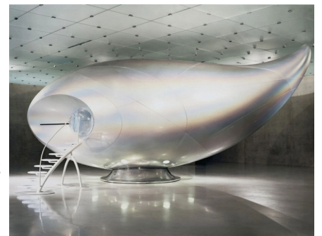
Mariko MORI, Wave-UFO , 1999-2002

est cohérent, emprunte aux désirs et à l'imaginaire du monde moderne pour élaborer une nouvelle mythologie où l'art et la vie se confondent, où le présent rattrape les « futurs » envisagés par la science fiction.