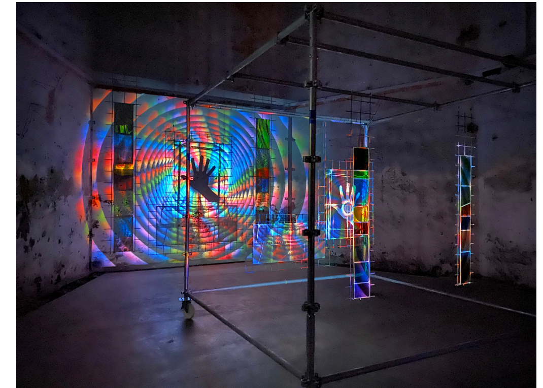
Ellipsis , Chapelle de l'Oratoire, Clermont-Ferrand, Journées Européennes du Patrimoine, Septembre 2020

La DIODE, 190-194 boulevard Gustave Flaubert 63000 Clermont-Ferrand, FR