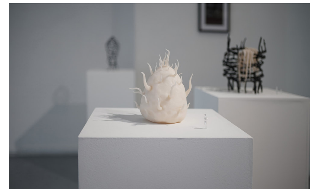
Morphogenetic Tensions , Golnaz Behrouznia |