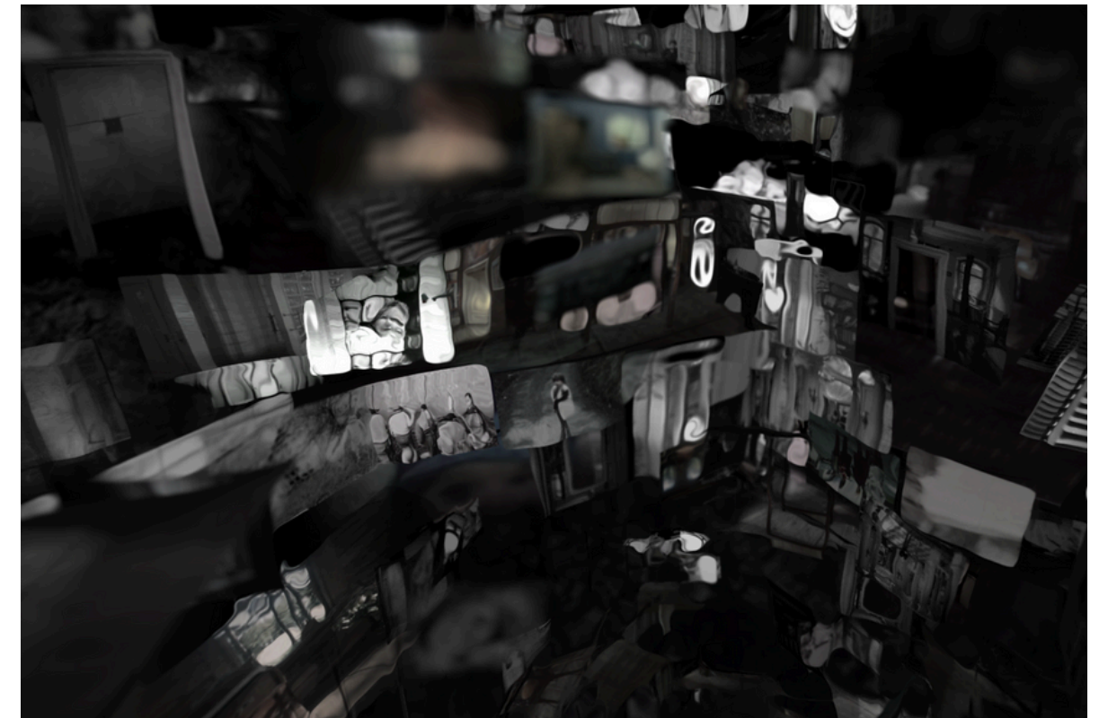
Monades et machines de mémoires

La DIODE, 190-194 boulevard Gustave Flaubert 63000 Clermont-Ferrand, FR