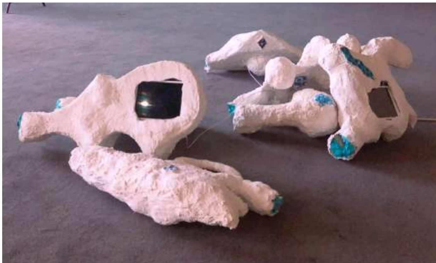
Souvenirs d'une sculpture , lycée Godefroy de Bouillon, Maison de la Culture, salle Gripel

L'installation interroge la perception, la mémoire et la fabrication d'une réalité par le regard.