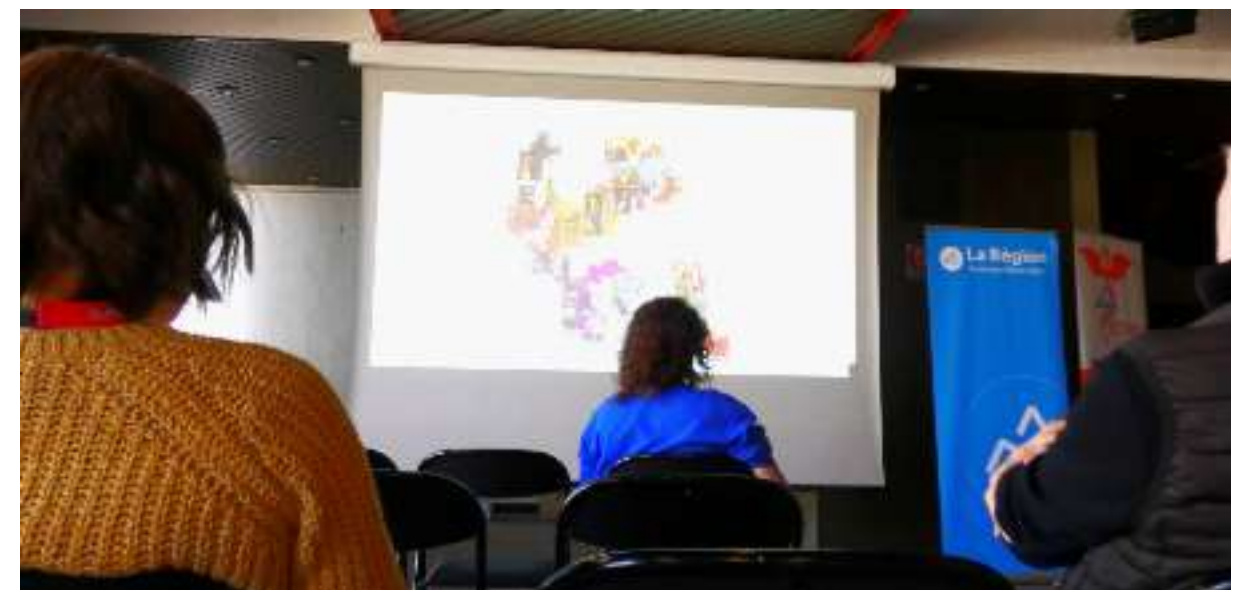
L'Accueil à l'œuvre , lycée Amédée Gasquet, Maison de la Culture, salle Gripel

Au sein de cette démarche complexe, ce projet s'articule avec la compétence principale développée tout au long de leur formation professionnelle : l'accueil, soit l'ensemble des dispositifs pour rencontrer et recevoir un public au sein d'un environnement et d'un événement particulier. La vidéo sonore présentée ici est une restitution numérique des productions collectives des élèves.