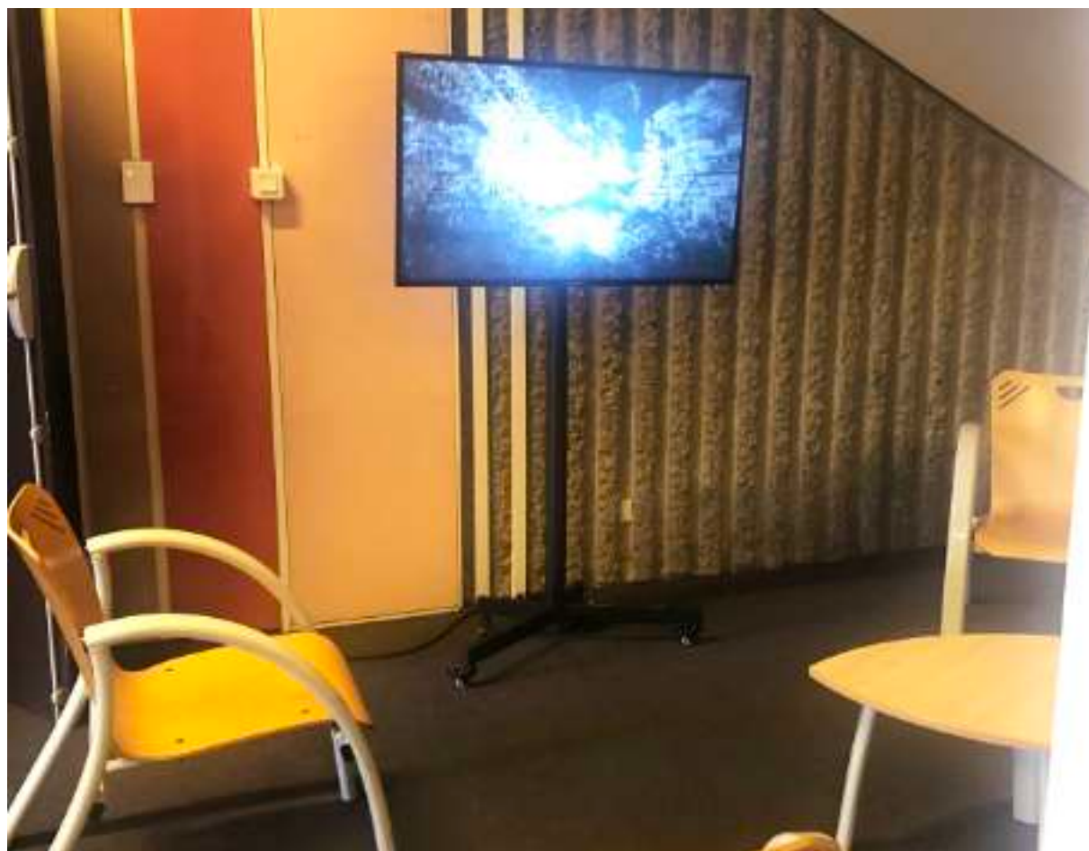
Création Vidéo « 1 Minute », Maison de la Culture, salle Gripel