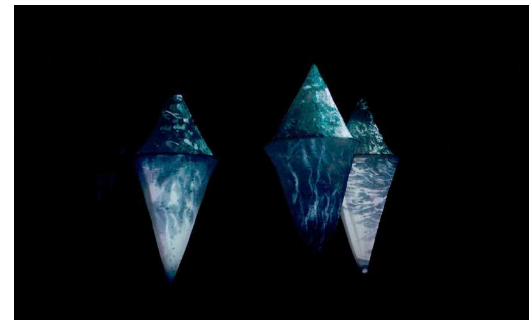
Geomorph Momenta , Golnaz Behrouznia | Salle Gilbert-Gaillard, Clermont-Ferrand | © photo : Golnaz Behrouznia | Festival VIDEOFORMES 2022