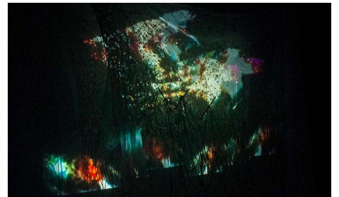
Tejer un cuerpo , Úrsula San Cristóbal | Salle Gilbert-Gaillard, Clermont-Ferrand | Festival VIDEOFORMES 2023